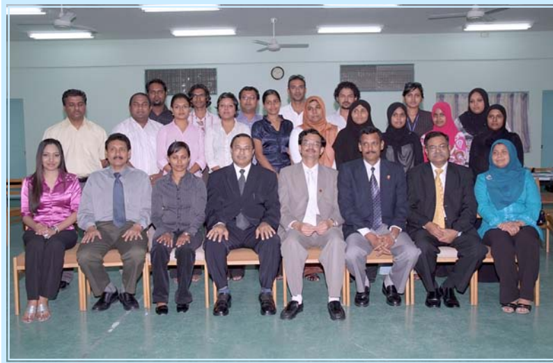
پرنسپل اور اسٹاف کے ساتھ 2008ء کی سالانہ تقریب کی تصویر اس وقت پرنسپل اور اسٹاف نے سالانہ تقریب کی تقریبوں میں شرکت کی سالانہ تقریب کی سالانہ تقریب 2008ء کی سالانہ تقریب کی سالانہ تقریب